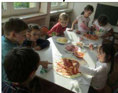
Atelier cuisine : pizza