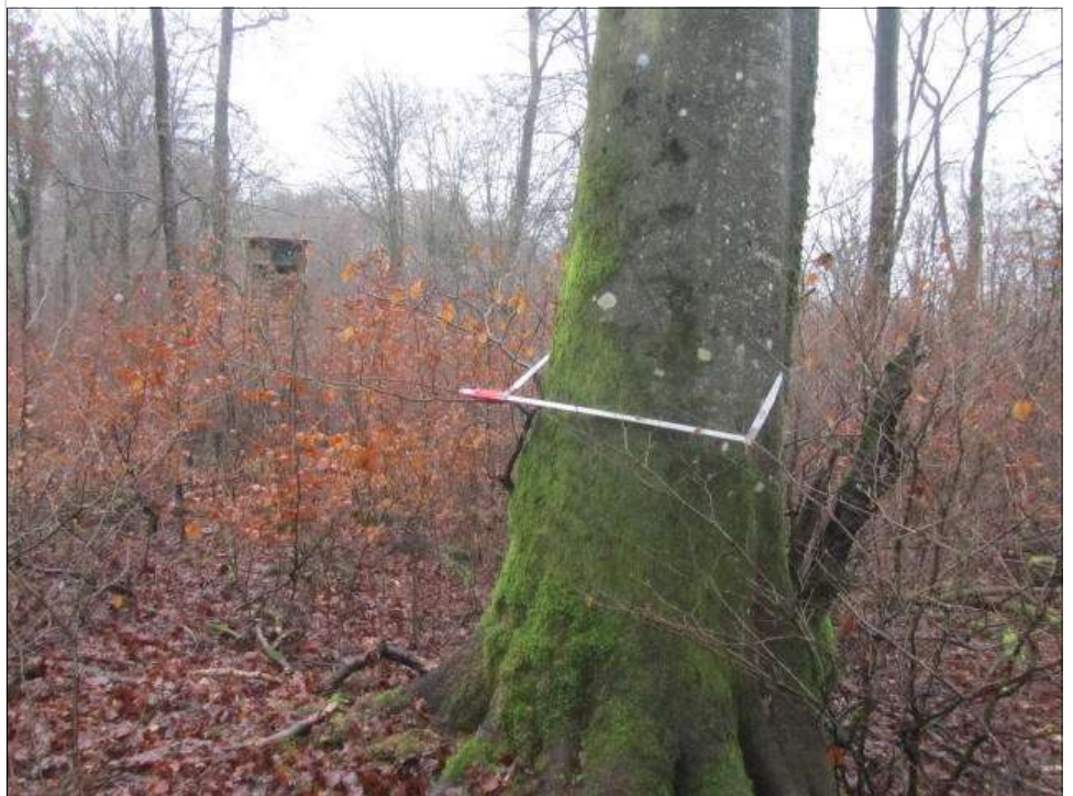
Hêtre de 75cm de diamètre (pris à 1.30 m de hauteur à l'aide d'un compas forestier), en arrière plan on voit la présence de régénération de Hêtre entre 1.5m et 3 m de hauteur qui représente l'avenir de la forêt : elle viendra en remplacement de ce vieillard à condition qu'on lui laisse la place, à temps.