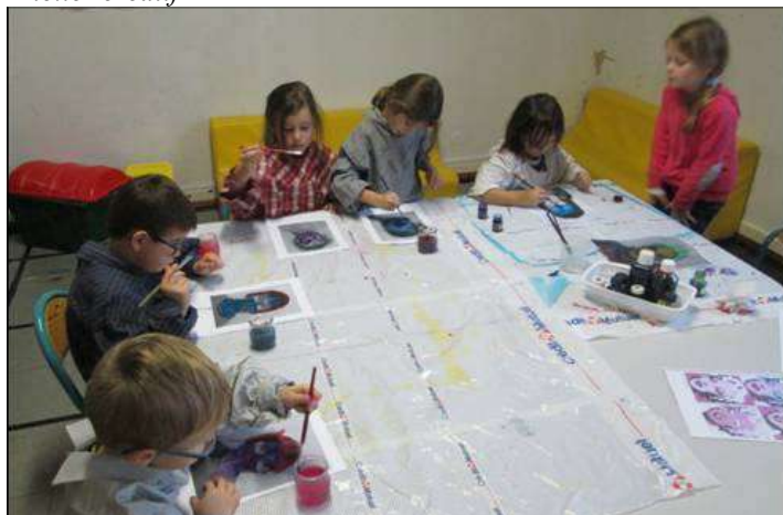
Les petits artistes