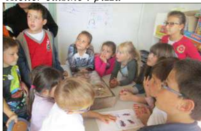
Arrivée de la fourmilière