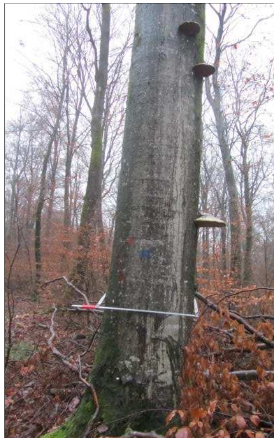
Hêtre de 75cm de diamètre, en fin de vie, recouvert de champignons, la nature poursuit son cycle : né poussière, redevient poussière...

bres adultes (faines pour le Hêtre ou glands pour le Chêne). Cette opération s'appelle la régénération et consiste principalement à doser l'arrivée de lumière au sol pour permettre le développement de semis naturels. Les peuplements jeunes qui en découlent, ne produiront plus de bois de valeur marchande pendant au moins une trentaine d'années et vont nécessiter au contraire un certain nombre de travaux sylvicoles assumés par la commune suivant les conseils techniques de l'Office National des Forêts gestionnaire. Il en résulte une transition brutale entre les vieux peuplements issus du traitement en taillis sous futaie et les jeunes peuplements issus du nouveau traitement en futaie.