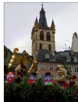
Marché de Noël de Trèves