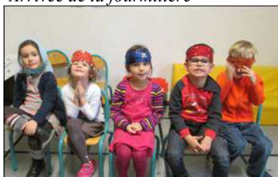
Préparation des petits pour le théâtre