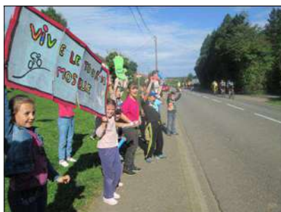
Tour de Moselle 2014