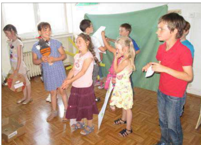
Représentation de la pièce des bourdons