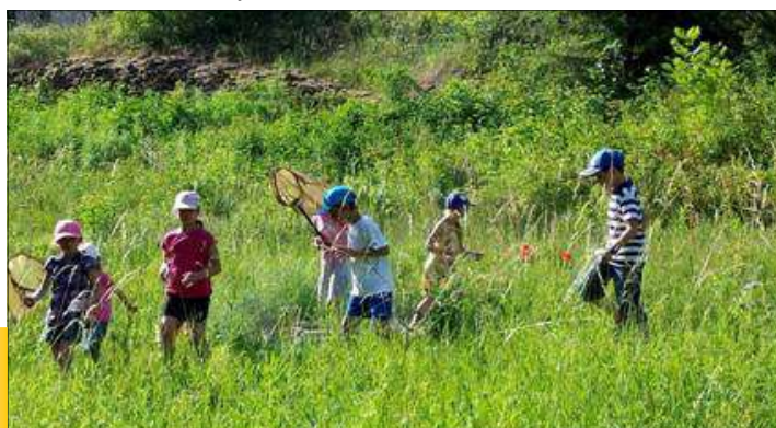
Chasse aux bourdons